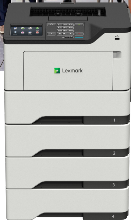
MS622de con bandejas opcionales

Confiabilidad. Seguridad. Productividad.